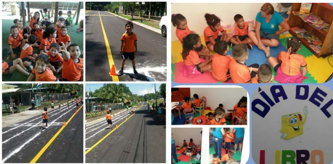
Día del Libro