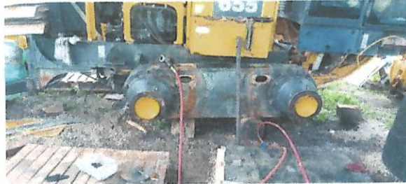
VI.2 Sistema hidráulico.